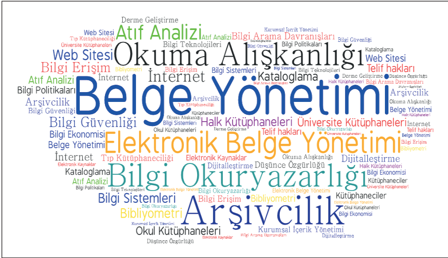
Şekil 1. Bilgi Dünyası 'nda yayımlanan yayınlarının konusal dağılım bulutu (2000-2019)

Tablo 6 verilerine göre, 2000-2009 yılları arasında Bilgi Dünyası dergisinde üç ve daha fazla sıklıkta işlenen konular listesinin ilk beş sırasında “belge yönetimi”, “okuma alışkanlığı”, “bilgi okuryazarlığı”, “arşivcilik” ve “üniversite kütüphaneleri” görülmektedir. “Atıf analizleri” ve “bilgi sistemleri” de sıkça ele alınan konular arasındadır. Halk kütüphaneleri, bilgi arama davranışları, bilgi güvenliği, okul kütüphaneleri ve bilgi erişim sayı olarak ilk 10 sırada işlenen konulardandır. Bilindiği gibi, Bilgi Dünyası dergisi Üniversite ve Araştırma Kütüphanecileri Derneği (ÜNAK)’nin resmi yayınıdır. Derginin 20 yıllık yayın yaşamı boyunca bir ülkenin en önemli ve lider araştırma kütüphanesi sayılan ulusal (milli) kütüphanesi ile ilgili hiç hakemli makalenin olmaması olumsuz anlamda dikkat çekici bir durumdur.