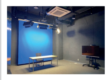
Video Kayıt Odası