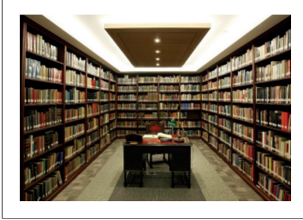
Kütüphane ve MJU-LG Kore Çalışmaları